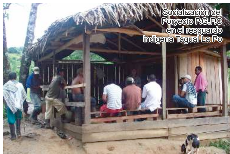
Socialización del Proyecto P.G.F.C en el resguardo indígena Tagual La Po

Esta forma de gobernar conlleva la toma de decisiones más horizontales, implica la cooperación entre los diferentes actores mediante procesos participativos en lo que se denomina redes mixtas entre lo público y lo particular. Estos procesos cooperativos suscitan acciones y la toma de decisiones consensuadas. Lo que envuelve este tipo de